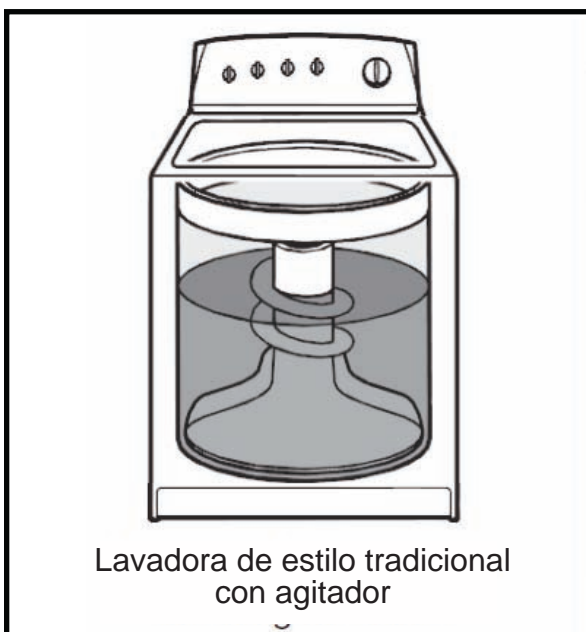
Lavadora de estilo tradicional con agitador

Esto es el funcionamiento normal. NO reemplace ninguna pieza. Si el agitador sólo se está moviendo en una dirección mientras está en el MODO DE PRUEBA (TEST MODE) y esto le preocupa, asegúrese de que haya agua en la canasta para que ésta ejerza un poco de resistencia al movimiento de agitación.