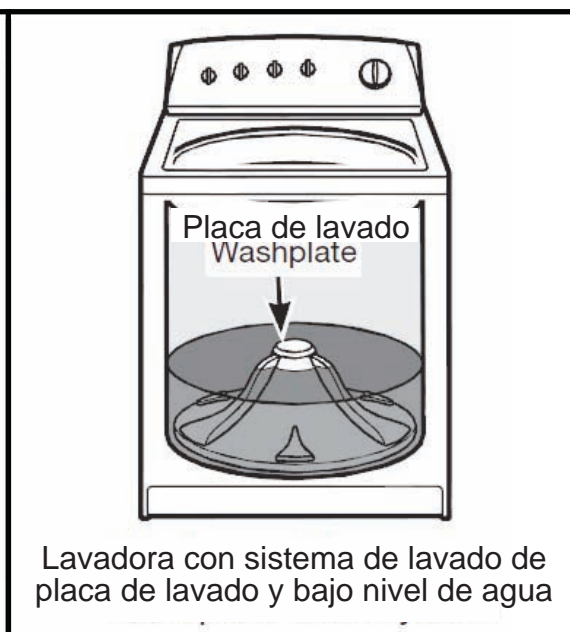
Lavadora con sistema de lavado de placa de lavado y bajo nivel de agua

TODOS LOS BOLETINES EN LÍNEA: http://www.servicematters.com/tech_ref/tech_ref_main.htm